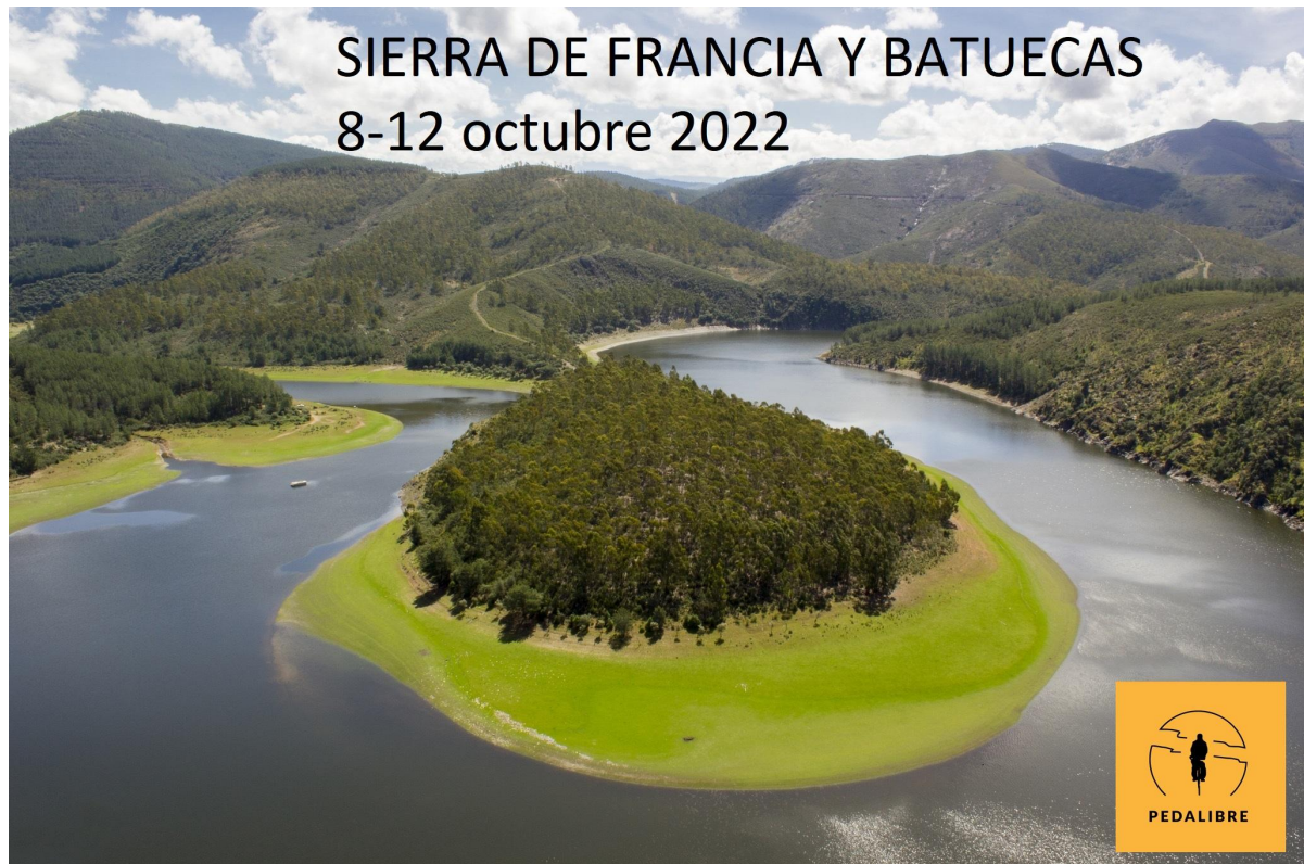
Mapa orientativo (ruta de primeros 2 días)